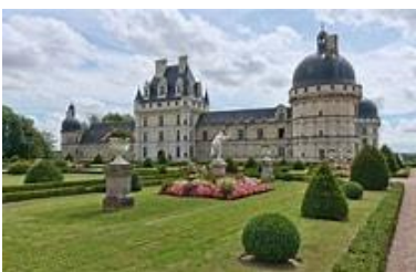
<<<< Château de Valençay

Toutefois et depuis le mois de juillet, il est possible de s'inscrire et ainsi montrer votre intérêt via mes adresses électroniques ( andre.degransart@skynet.be et/ou gmail.com ) ou au N° 068 / 44 90 96 -pour les personnes ne possédant pas d'adresse électronique- et verser un p'tit acompte de 25€ sur le compte bancaire des AN/Ath = BE60 0001 1786 2070 avec pour communication : ' Vie de Châteaux 2024 '. Je me chargerai de confirmer la réception de votre courriel et d'informer régulièrement le bureau de la 'MV' de l'avancée des préinscriptions.